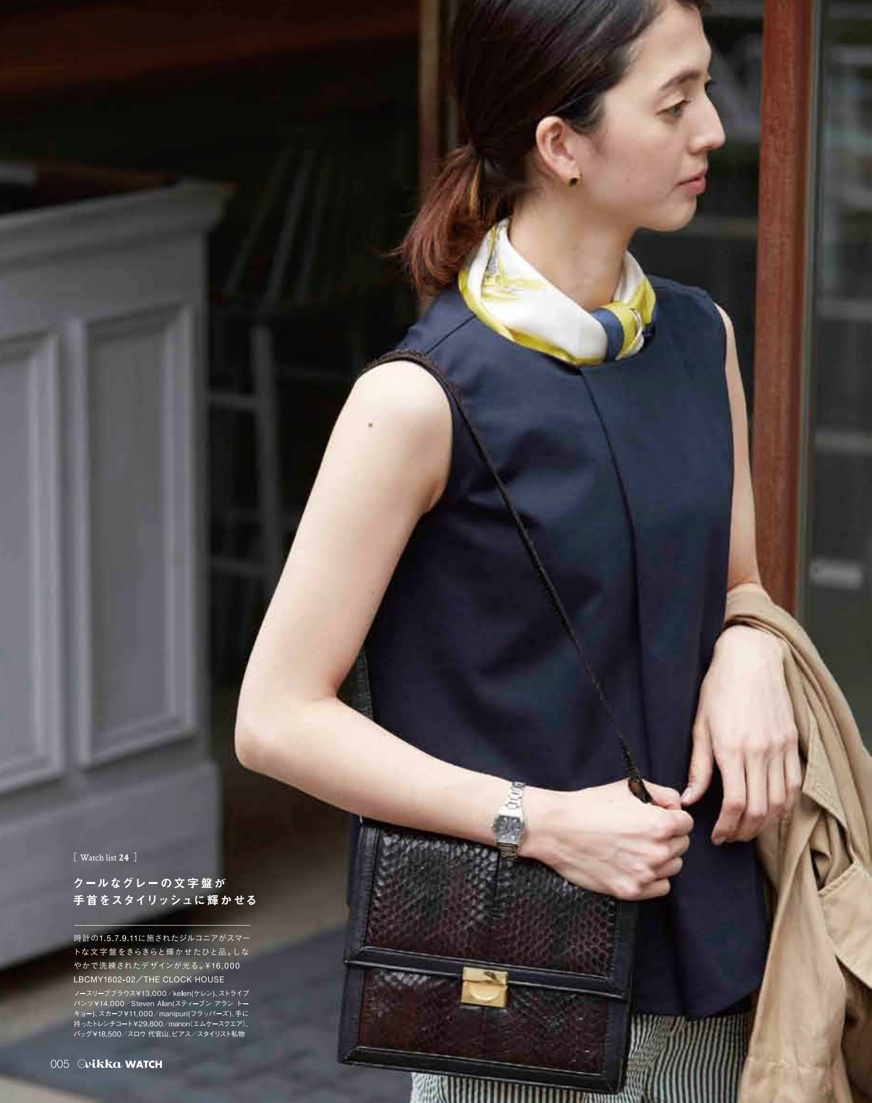
[ Watch list 24 ]