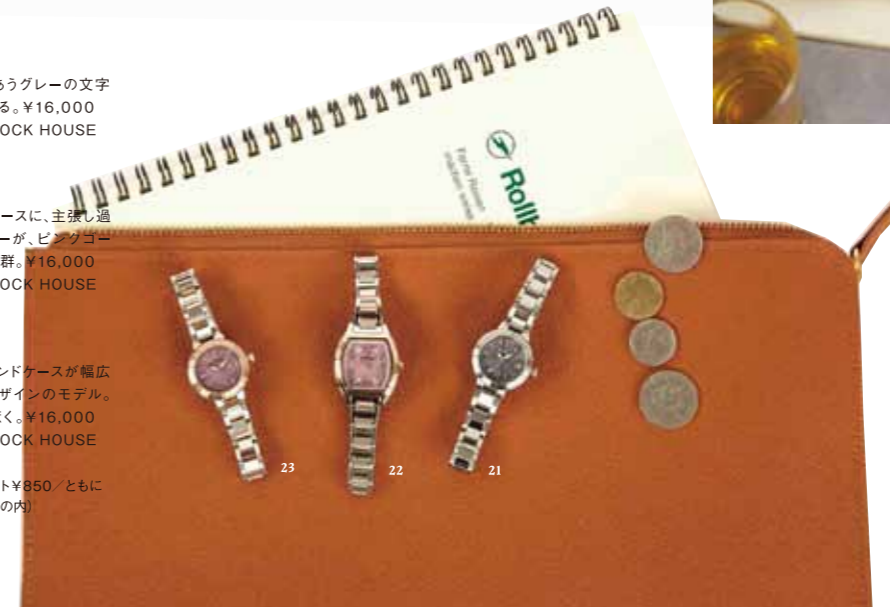
[ Watch list 20 ]

ドキュメントケース ¥4,500、ノート ¥850 / ともに DELFONICS(デルフォニックス丸の内)