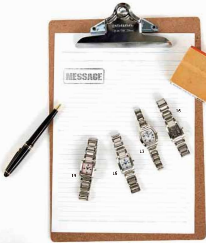
[ Watch list 16 ]

ライトブラウンのバンドと磨きのかかったゴールドカラーのケースが手元を明るく演出し、いつもの癒しをワンランクアップしてくれる。¥14,000 LBCMY1602-08 / THE CLOCK HOUSE