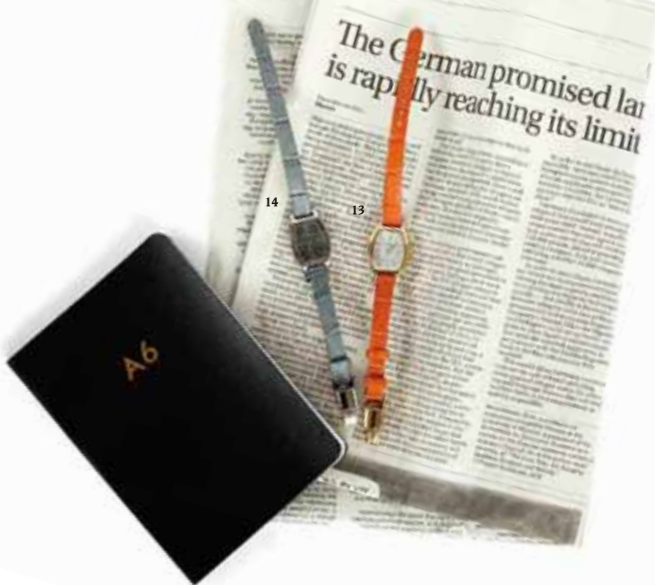
[ Watch list 14 ]

主張し過ぎないデザインがさまざまなビジネスシーンで活躍する。上品な趣きとシックなカラーが特徴的。¥14,000 LBCMY1602-09 / THE CLOCK HOUSE