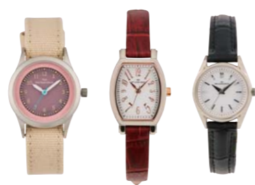
CASUAL BUSINESS BUSINESS FORMAL

右: ベーシックで飽きのこない逸品。¥14,000 LBFSSH1701-01 ※2017年1月発売 中: 優雅なトノー型フォルムが女性らしい。¥14,000 LBSCSH1602-07 左: キャンバス素材のバンドで軽やかさを演出。¥14,000 LCAMY1604-09 / 以上すべてTHE CLOCK HOUSE