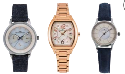
¥18,000 LCAMY1611-01LIM ¥18,000 LBSCSH1611-01LIM ¥18,000 LBFMY1611-01LIM