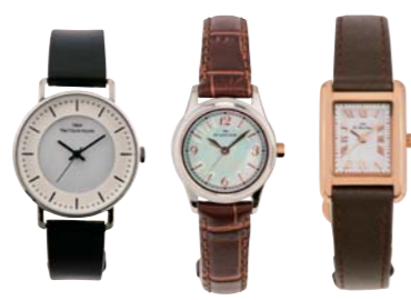
CASUAL BUSINESS BUSINESS FORMAL

右: ハンサムなレクタンギュラーケース。¥16,000 LBFMY1603-03 中: 型押ししたレザーバンドで端正に。¥16,000 LBSCSH1612-14 ※12月発売 左: シンプルな美を追求したミニマルデザイン。¥16,000 LCAMY1604-10 / 以上すべてTHE CLOCK HOUSE