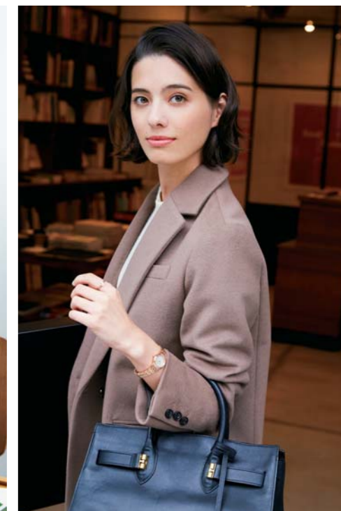
SCENE. 01 BUSINESS FORMAL

コンビデザインのクールな表情。ハンサムウーマンのための毎日のパートナーにふさわしい優秀ウォッチ。¥16,000 LBSCSH1612-12 ※12月発売 / THE CLOCK HOUSE