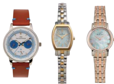
CASUAL BUSINESS BUSINESS FORMAL

右: ジルコニアのきらめきを垂ねて華麗さを極めたコンビモデル。¥18,000 LBFSSH1612-02 ※12月発売 中: 優美にツヤめくトノー型。¥18,000 LBSCSH1612-08 ※11月発売 左: 機能性を備えたボーイズサイズ。¥18,000 LCAMY1611-02 / 以上すべてTHE CLOCK HOUSE