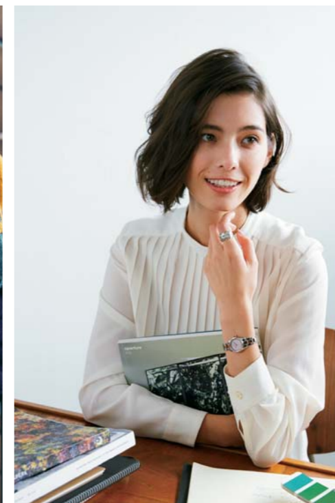
SCENE. 02 BUSINESS CASUAL

スイーツを想わせるような可愛らしいカラーリング。日付、曜日、24時間計付きで、休日の旅スタイルにも活躍。¥18,000 LCASH1611-01 ※12月発売 / THE CLOCK HOUSE