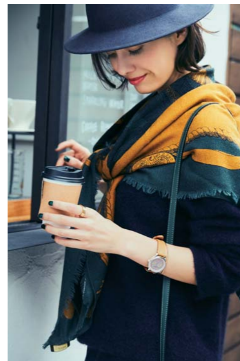
SCENE. 03 CASUAL

「ビジネスフォーマル」「ビジネスカジュアル」「カジュアル」の3つのスタイルやシーンに合わせてウォッチを展開。さまざまなオカージュに対応するラインアップで、しなやかな大人の女性にふさわしい腕元を彩る。